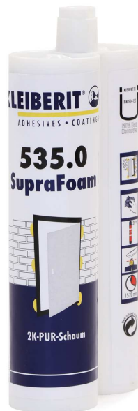
SupraFoam DZ vo dvojitej kartuši